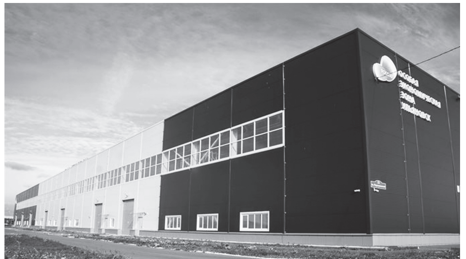
Производство «НТМ Групп» начнет на площадях, арендованных в индустриальном парке «Платформа» на территории ПОЭЗ «Ульяновск». «Платформа» представляет собой четырехэтажный комплекс типовых производственных и офисных помещений, общая площадь которого 14 тысяч кв. м. В нем смогут разместиться порядка 20 резидентов разного профиля. Объем инвестиций частных компаний в создание парка составил 450 млн рублей. На прилегающей к зданию территории предусмотрено оборудование открытой площадки для хранения грузов, а также парковок для легкового и грузового автотранспорта. Помимо готовой инфраструктуры, налоговых льгот, преференций, действующих в ПОЭЗ, резидентам предоставляется возможность выбора свободной планировки помещений.

«В Ульяновской области много талантливых творческих людей. Отрадно, что свои хобби и увлечения они трансформируют в реально работающие проекты креативного сектора экономики. И мы готовы